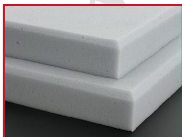
Vue Angle (plaques avec chanfreins)

Pour 1 carton (40 plaques) : 44,52 € HT la plaque Livraison gratuite* Pour 2 cartons (80 plaques) : 37,28 € HT la plaque Livraison gratuite*